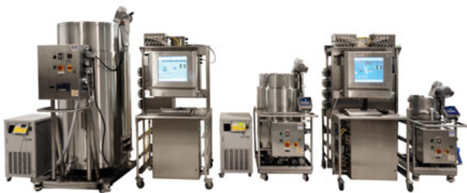
Системы контроля биореакторов компании Finesse для лабораторий и промышленного применения

Конструкция биореакторов позволяет выдерживать оптимальные условия для роста клеток или бактерий. Она создаёт окружающую среду, которая присутствует в биотехнологическом производстве таких веществ, как замещающие клетки, фармацевтические препараты, антитела или вакцины. Это производство требует жёсткого контроля температуры, pH, растворенного кислорода и давления. Для создания идеальной среды необходимо правильное сочетание этих параметров, что позволяет создать однородную среду выращивания клеток. Такая среда является идеальным местом для роста, как желаемого, так и нежелательного вещества, поэтому чистота является ключевым фактором. Сегодня многие поставщики биореакторов предлагают компоненты для одноразового использования, стерильные сменные камеры и одноразовые датчики, и всё это является сильной стороной предложения компании Finesse.